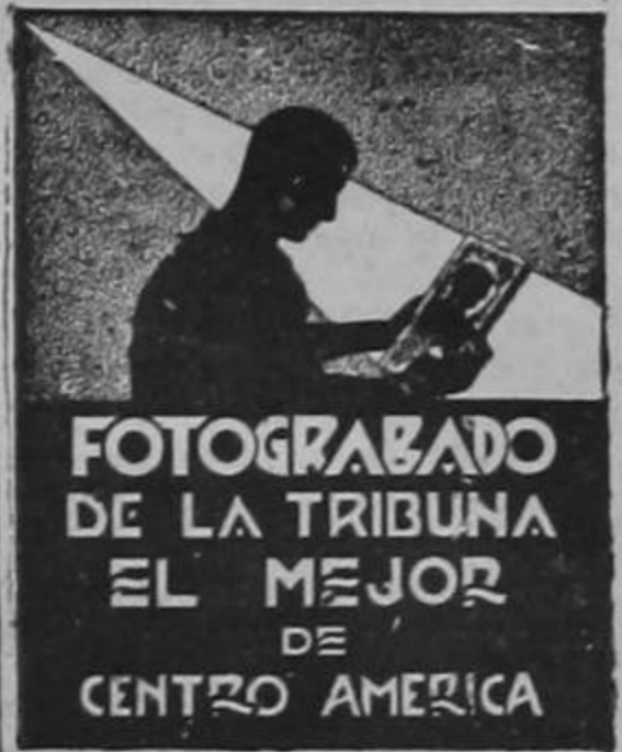
FOTOGRAFADO DE LA TRIBUNA EL MEJOR DE CENTRO AMERICA

WASHINGTON, 11. UP La cámara de representantes aprobó la ley contra los linchamientos, la cual fué transmitida al senado. La nueva ley sanciona el "crimen federal", sancionando las leyes del gobierno central de Washington. Se prevé que la ley tendrá en el senado oposición de los senadores de los Estados del Sur, que niegan al gobierno federal autoridad en esta materia. Las estadísticas indican que en 1935, 3 en 1933 y 2 en 1939.