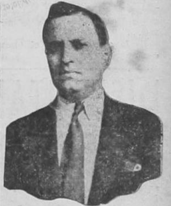
DR. CALDERON GUARDIA